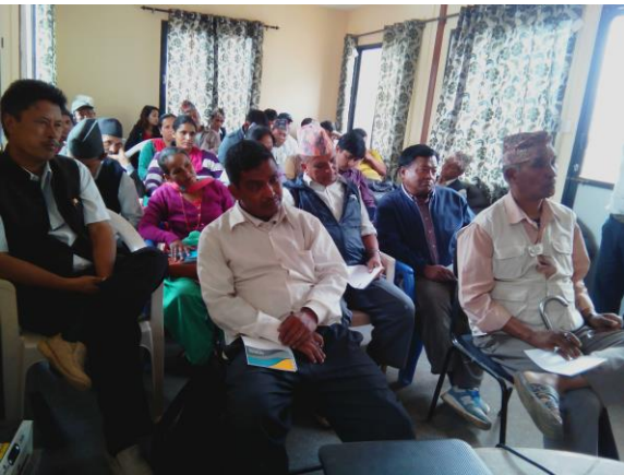
लैंगिक परीक्षण कार्यक्रमका सहभागीहरु