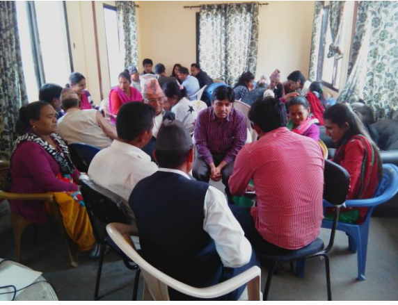
लैंगिक परीक्षण कार्यक्रममा समूहगत छलफल गरिदै