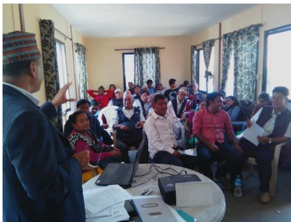
लैंगिक परीक्षण कार्यक्रममा नगरपालिकाका कार्यकारी प्रमुख सहित सहभागिहरु