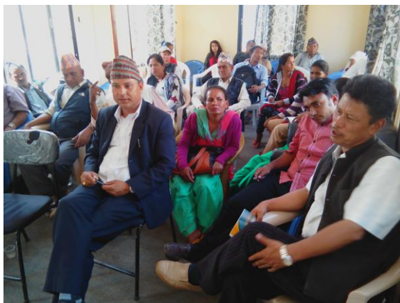
लैंगिक परीक्षण कार्यक्रममा नगरपालिकाका कार्यकारी प्रमुख सहित सहभागिहरु