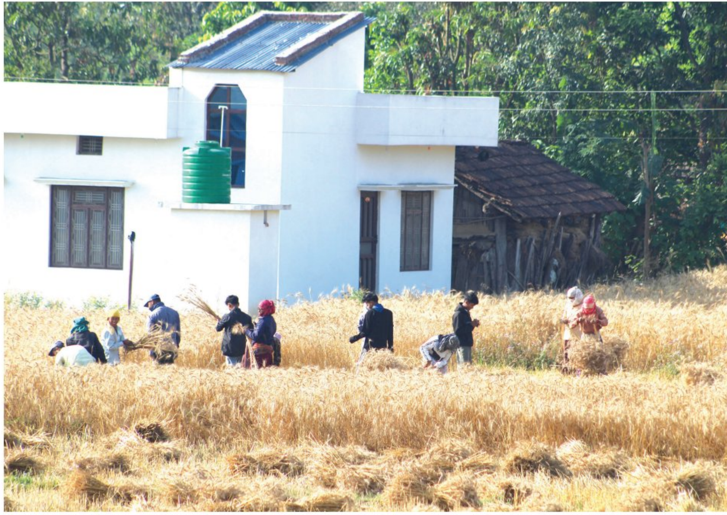
कञ्चनपुरको शुक्लाफाँटा नगरपालिका-२, रानीपुरका किसान खेतमा पाकेको गहुँ काट्दै ।